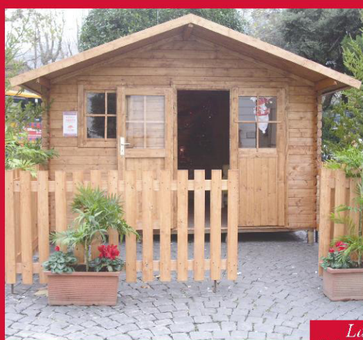
La città di Babbo Natale in piazza Abbro